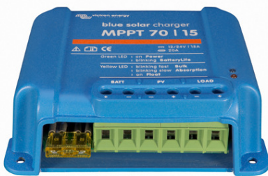
Solarer Laderegler MPPT 70/15